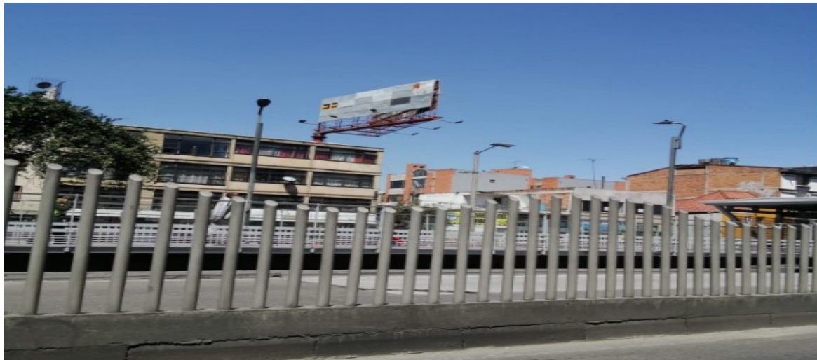
Foto 1 Vista panorámica del predio y de la estructura de la valla tubular instalada en la AK 14 55 39 (dirección catastral), orientación Sur - Norte