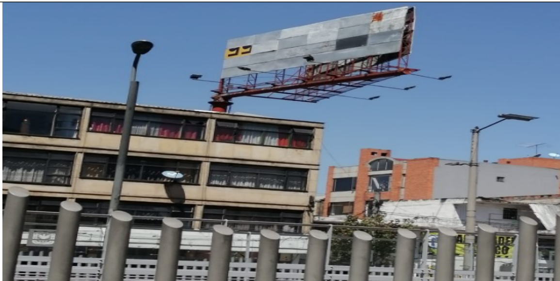
Foto 2 Vista frontal de la estructura de la Valla tubular instalada en la AK 14 55 39 (dirección catastral), orientación Sur - Norte.